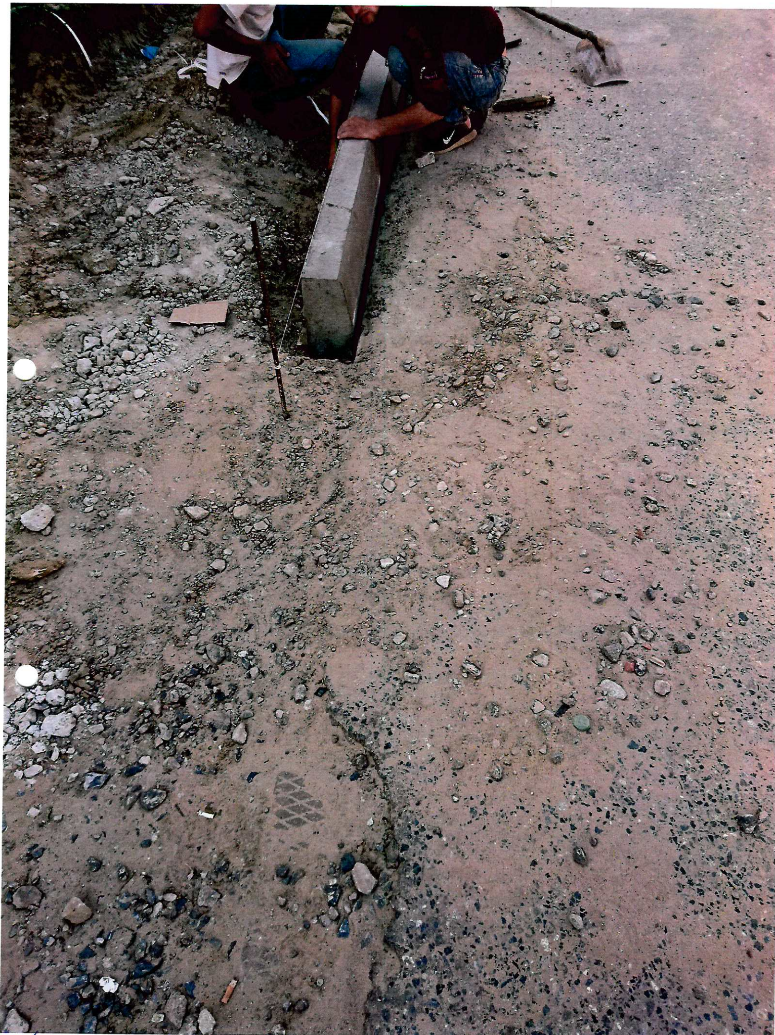
ремонт бортов (тротуара) по ул. Доблудная 04.06.18.