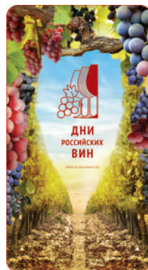
Сторона 2 62x115мм