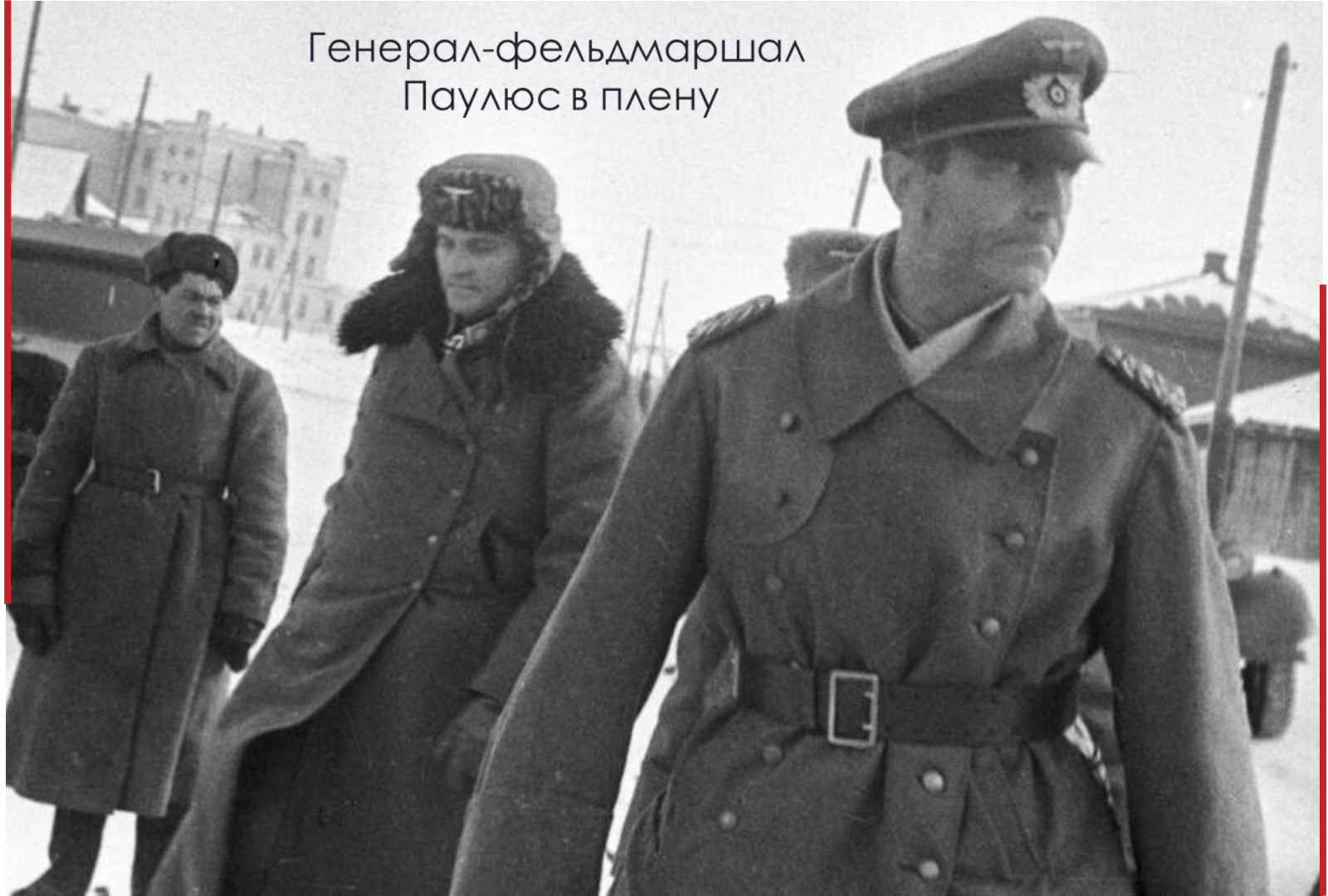
Генерал-фельдмаршал Паулюс в плену