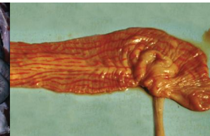
Толстая кишка, с полосами кровоизлияний («полоски зебры») на складках слизистой оболочки.