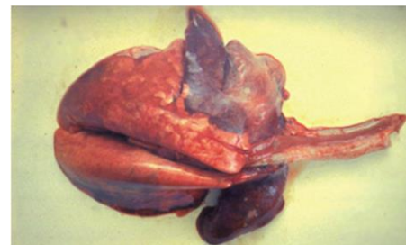
Застойные явления долей легких.