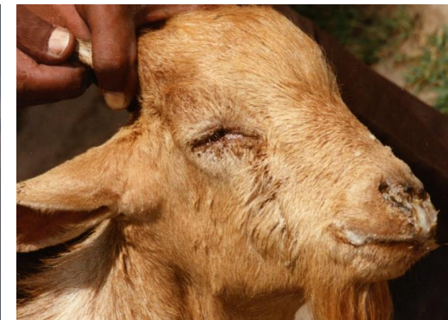
Выделения из глаз, носа и рта