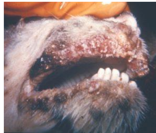
Эрозивные поражения ротовой полости

Профилактика основана на комплексе мероприятий по предотвращению заноса заболевания в РФ.